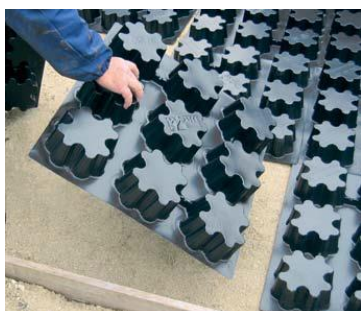
COLOCACIÓN DEL MOLDE PARA EL HORMIGÓN Y LA HIERBA