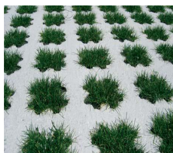
PAVIMENTACION REALIZADA CON EL MOLDE PARA EL HORMIGÓN Y LA HIERBA MODI