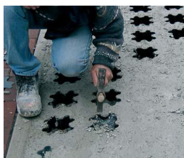
HAY QUE ROMPER LOS ESPACIOS VACIOS DEL MOLDE, PRECORTADOS CON LA FORMA DE CUADRIFOLIO