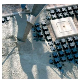
FASE DE HORMIGONADO A RAS DE LA PARTE SUPERIOR DEL MOLDE