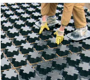
COLOCACIÓN DE LA MALLA ELECTROSALDADA