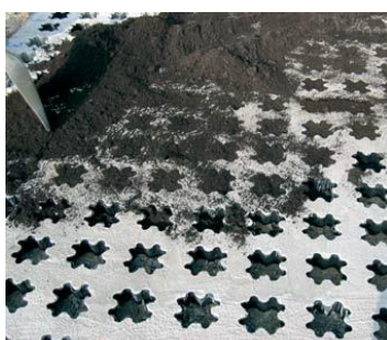
LLENADO DE LOS ESPACIOS VACIOS CON TIERRA VEGETAL