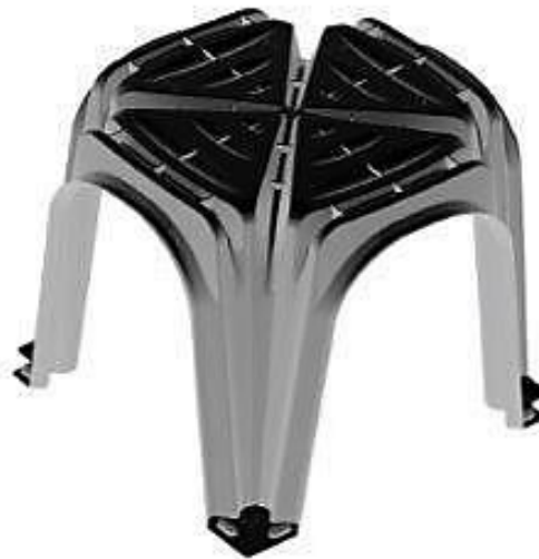
Particolare del campione sottoposto a prova.