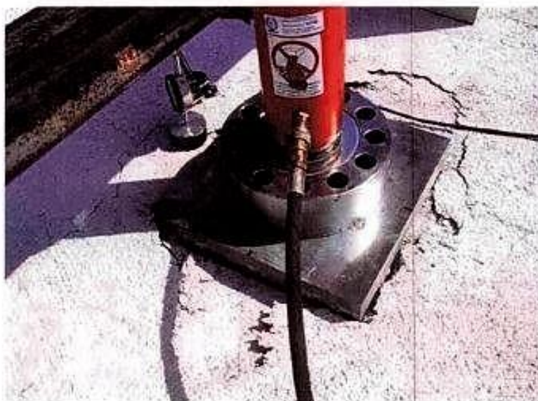
Particolare del sistema di carico e modalità di rottura del campione.