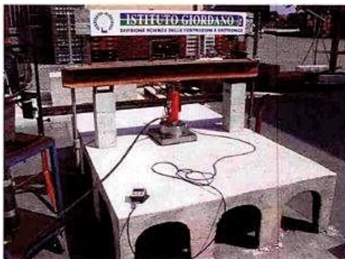
Fotografia dell'insieme di prova (banco e campione in prova).