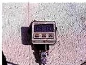
Particolare dell'elemento collassato in mezzera e della lettura del carico massimo.