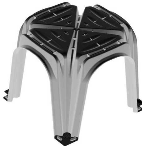
Particolare del campione sottoposto a prova.