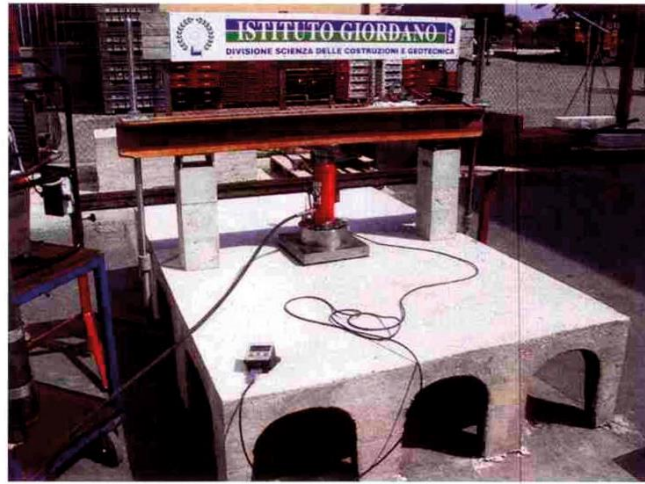
Fotografia dell'insieme di prova (banco e campione in prova).