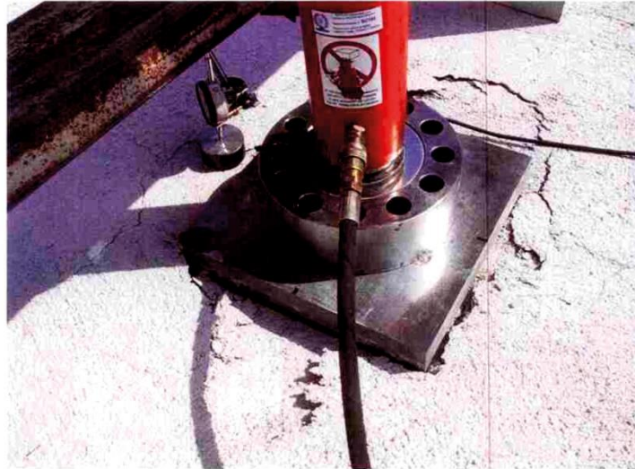
Particolare del sistema di carico e modalità di rottura del campione.