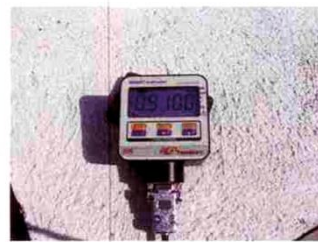
Particolare dell'elemento collassato in mezzeria e della lettura del carico massimo.