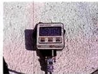
Particolare dell'elemento collassato in mezzeria e della lettura del carico massimo.