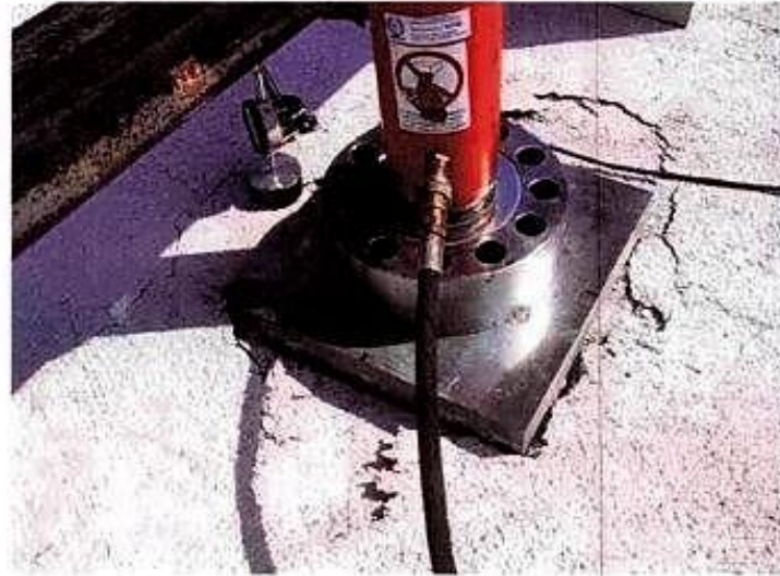
Particolare del sistema di carico e modalità di rottura del campione.