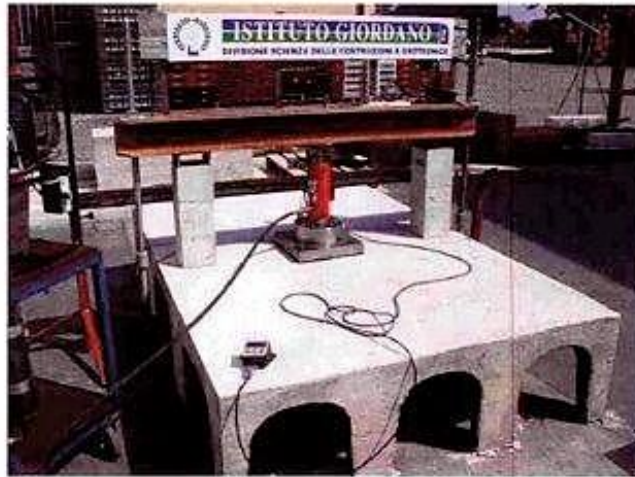
Fotografia dell'insieme di prova (banco e campione in prova).