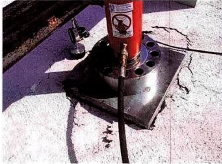
Particolare del sistema di carico e modalità di rottura del campione.