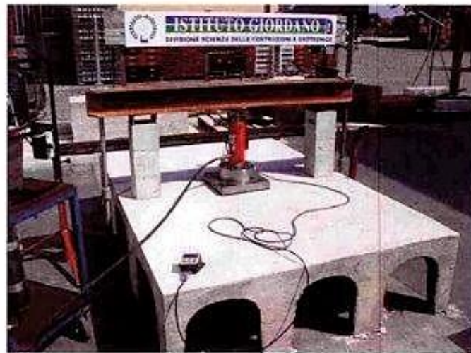
Fotografia dell'insieme di prova (banco e campione in prova).